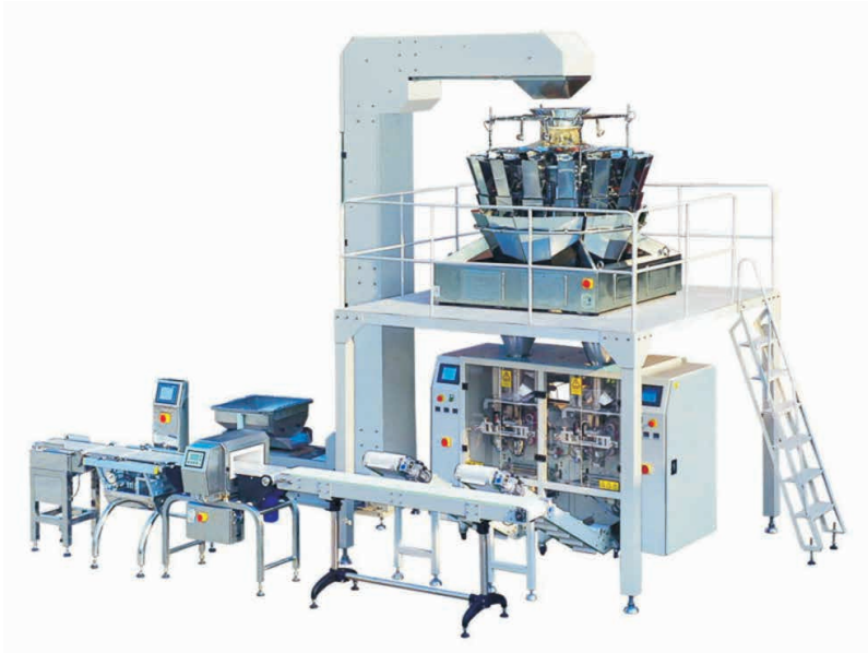
SBM -Twin-Verpackungslinie inkl. Mehrkopfwaage und Etikettierstation