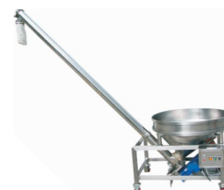
Schneckendosierung für Pulver, Puder