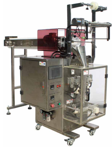
SBM-150B inkl. Zuführförderband mit Fächern für Kleinteile