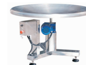
Abb. Rotierender Sammelsteller