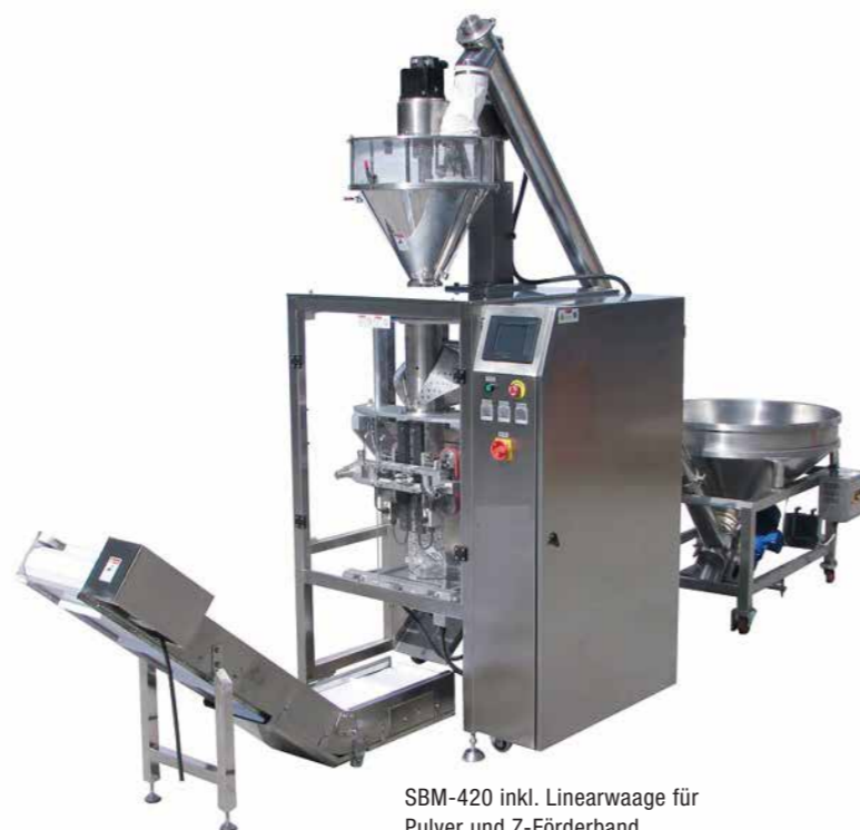
SBM-420 inkl. Linearwaage für Pulver und Z-Förderband